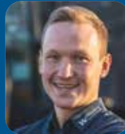
Oke Storm Produktspezialist/WMS 0172/3999775